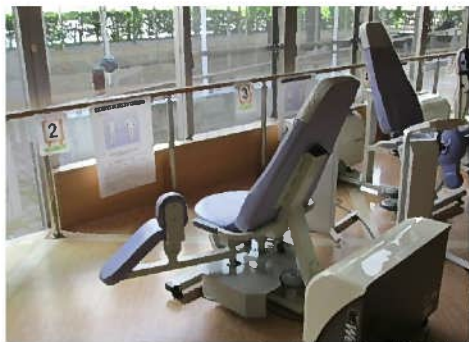
ヒップアブダクション