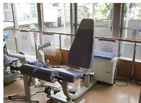
レッグエクステンション