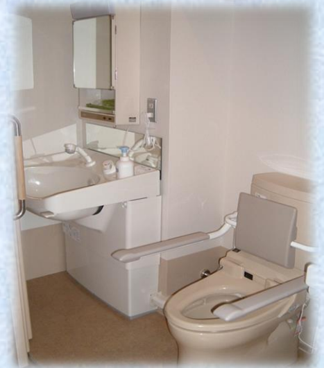
居室内トイレ・洗面台